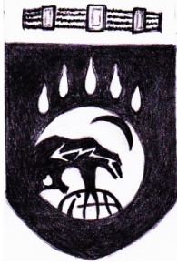
order Godland Östersjöväldet